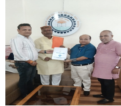
MOU with NGO-Human Unique Moment Development Organisation Bhopal