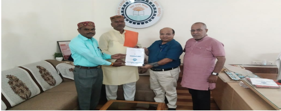
MOU with NGO- Sant Ravidas Seva Samiti Sansthan Bhopal MP